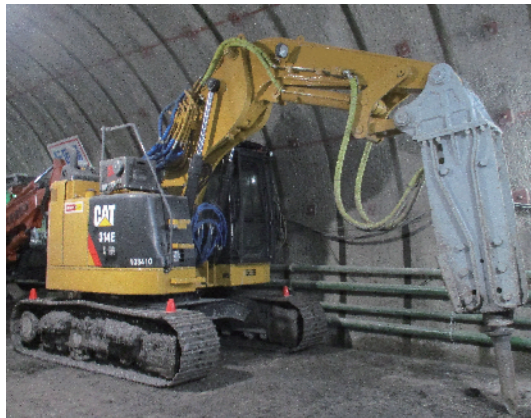
T-PROBO: トンネル工事に特化したモデルです。8t、15t、20tクラスの油圧シヨベルに対応します。

2ピースブームの構成部品である1本のピンを抜き差しするだけで、解体等高所工事用のストレートポジション、掘削等通常工事用のバンドポジションの2形態での活用が可能です。ミニシヨベルクラス対応により、ピンの抜き差しは現場作業員により短時間で簡単に行えます。