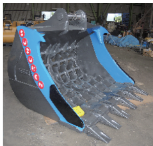
30tクラス大型RODEOバケット

解体工事現場等において高速で飛散する瓦礫などからオペレーターを守る心強いプロテクターです。従来の網型や柵型では隙間を通過してしまい防ぎきれなかった小さな鉄筋片やボルト片も、強力なポリカーボネート(PC)製の透明樹脂パネルでしっかり防御します。