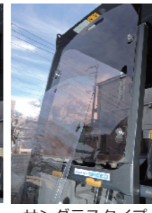
サングラスタイプ